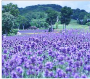
ทุ่งลาเวนเดอร์ทัมมาระ