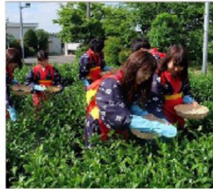
กิจกรรมเก็นซา