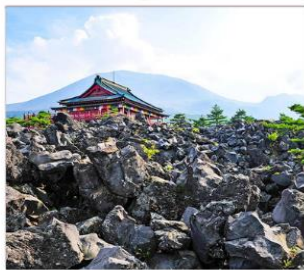
สวนโอนิโอบิตาชิ