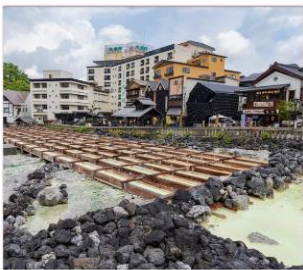
คุซัทสึออนเซน