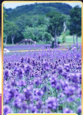
ทุ่งลาเวนเดอร์ที่มบาระ