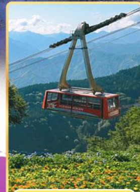
นั่งกระเช้าชูซาว่าโคเอ็น