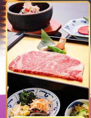
บุฟเฟ่ต์ ROKKASEN

ออนเซ็น 2 คั้น นน.กระเป๋า 23 กก. 7Days 4Night