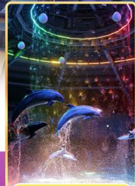
อควาพาร์ค ซินางาวะ