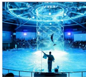
Maxell Aqua Park