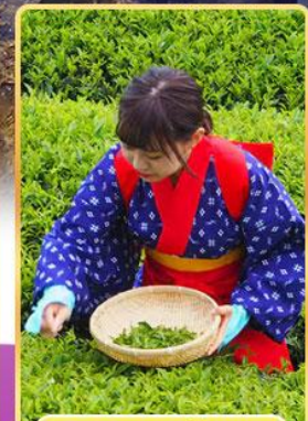
กิจกรรมเก็บชา