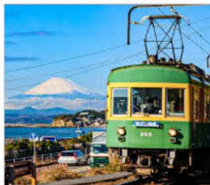
นั่งรถไฟเอโนะเด็น