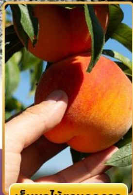
เก็บผลไม้ตามฤดูกาล

ออนเซ็น 3 คืน นน.กระเป๋า 23 กก. 8Days 5Night