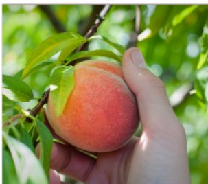
เก็บผลไม้ตามฤดูกาล