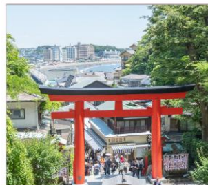
ถนนเม็นไซเท็นเอโนะชิมะ