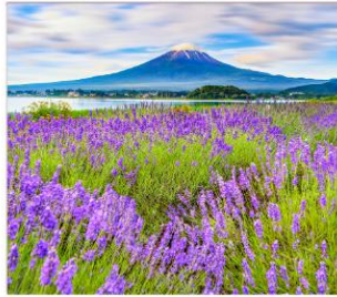
ทุ่งลาเวนเดอร์โอะอิชิฮารุ