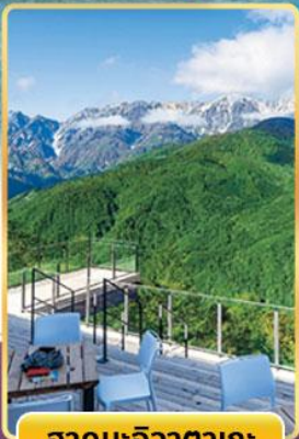
ฮาคุบะอิวาตากะ