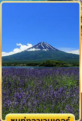
ชมทุ่งลาเวนเดอร์