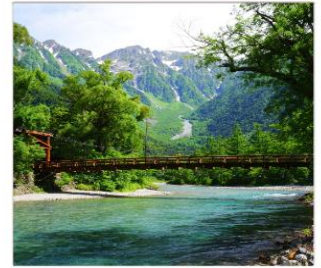
คามิโดจิ(สะพานกับปะ)