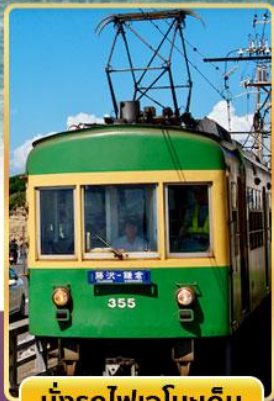
นั่งรถไฟเอโนะดะ