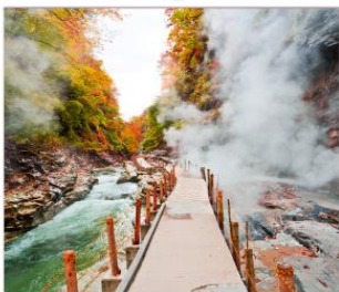
ชมเขาโอยาสึเดียว