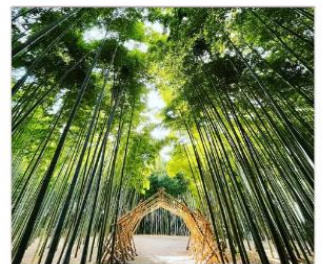
ป่าไผ่วากายามะ