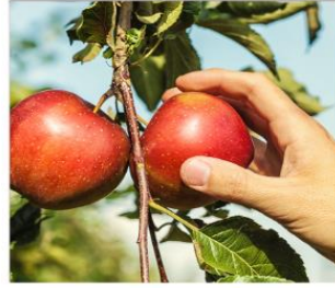
กิจกรรมเก็บแอปเปิ้ล