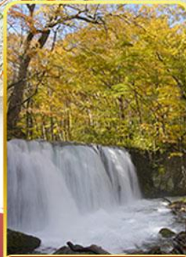
ลำธารโออิราเสะ