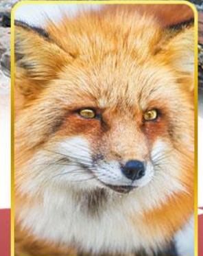
ฟาร์มสุนัขจิ้งจอก