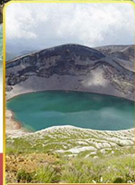
ปากปล่องภูเขาไฟฮาโอะ