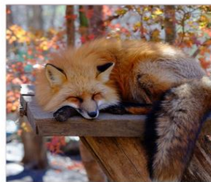
ฟาร์มสุนัขจิ้งจอก