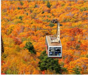
นั่งกระเช้าฮักโกดะ