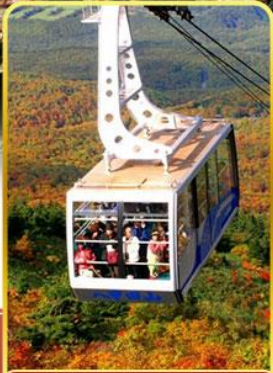
นั่งกระเช้าอากิโกะ