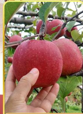
กิจกรรมเก็บแอปเปิ้ล