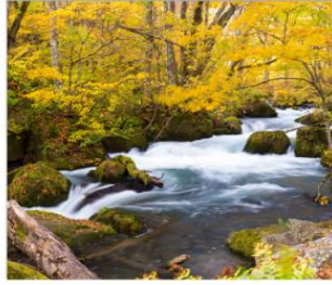
เดินเล่นลำธารโออิราสะ