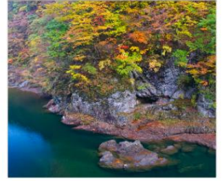
ชมเขาดากิไดริ