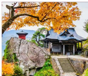
วัดยามาเดระ