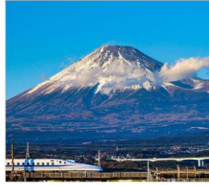
นั่งชินคันเซนชมฟูจิ