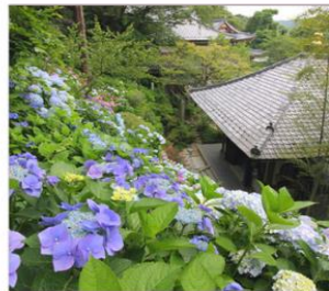
วัดฮาเซเดระ(เดรนเยีย)