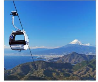
ชิบุพานิรามาริว