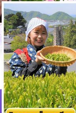
กิจกรรมเก็บชาเขียว