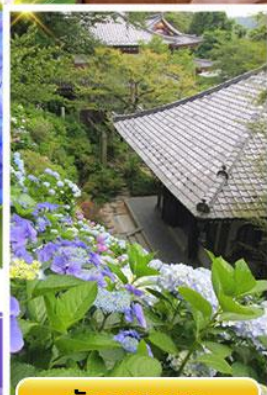
วัดฮาเซเดระ