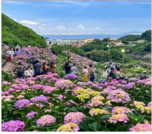
เทศกาลดอกไฮเดรนเยีย