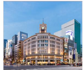
กินซ่าช้อปปิ้ง

THAI สายการบินไทย บริการทุกระดับประทับใจ FULL SERVICE