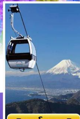
อีซูพานรามาวิว