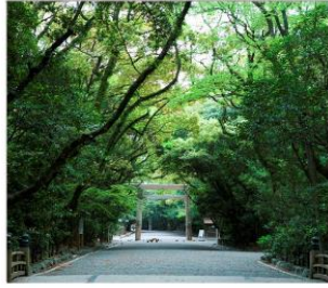
ศาลเจ้าอัสึตะ