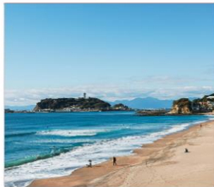
เกาะเฮโนชิมะ