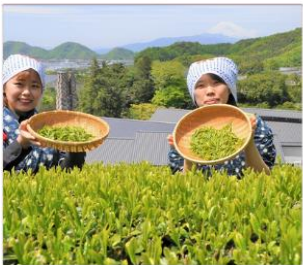
กิจกรรมเก็บชา