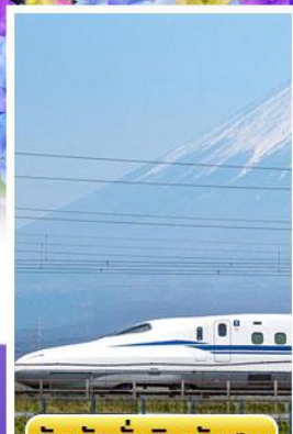
สัมผัสนั่งชินคันเซน