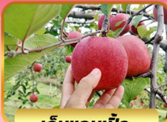
เก็บแอปเปิ้ล