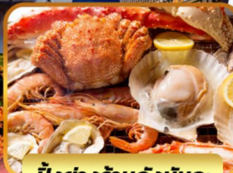
บ๊องย่างร้านดังนัตตะ