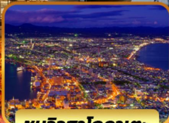
ชมวิวฮาโกดาเตะ

HAKODATE KOKUSAI HOTEL 1 คััน TOYA SUN PALACE 1 คััน JOZANKEI VIEW HOTEL 1 คััน SAPPORO STREAM 2 คััน